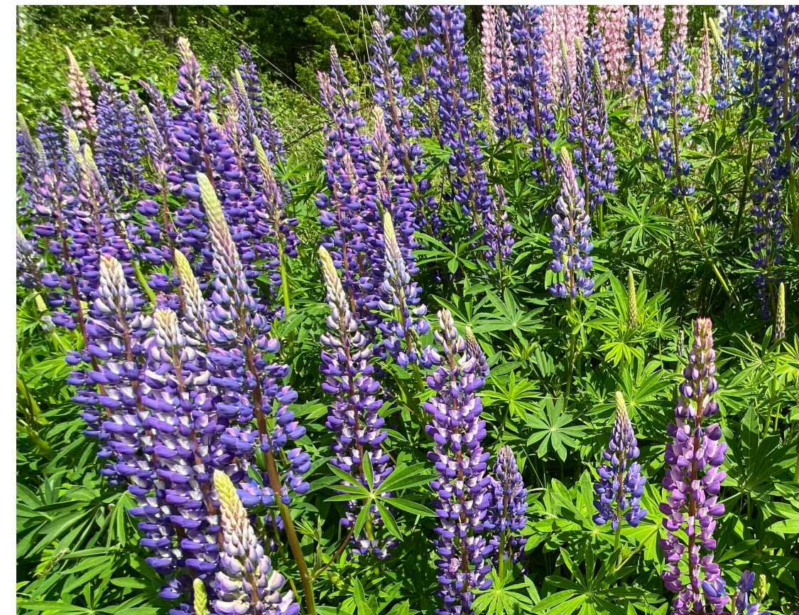
Bestånd med blomsterlupin

Invasiva växdelar ska aldrig slängas i naturen utan ska slängas i kärl märkta med invasiva arter eller lämnas till personalen på Atleverkets Återvinningscentral, förpackade i platsäckar. Om du bara har några stycken kan du slänga dem i restavfallspåsen men kom ihåg dubbelknuten för förslutning.