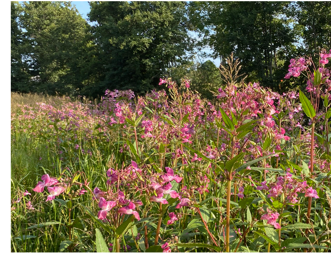
Bestånd med jättebalsamin