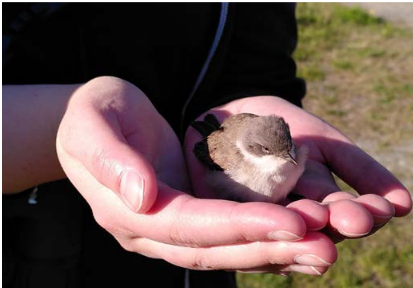
Bild: Finns det möjlighet att följa med ut på en ringmärkning och få hålla en fågel i handen, så är det en bonus. Kolla med en fågelförening eller fågelstation om de har någon ringmärkningsverksamhet ni kan besöka.