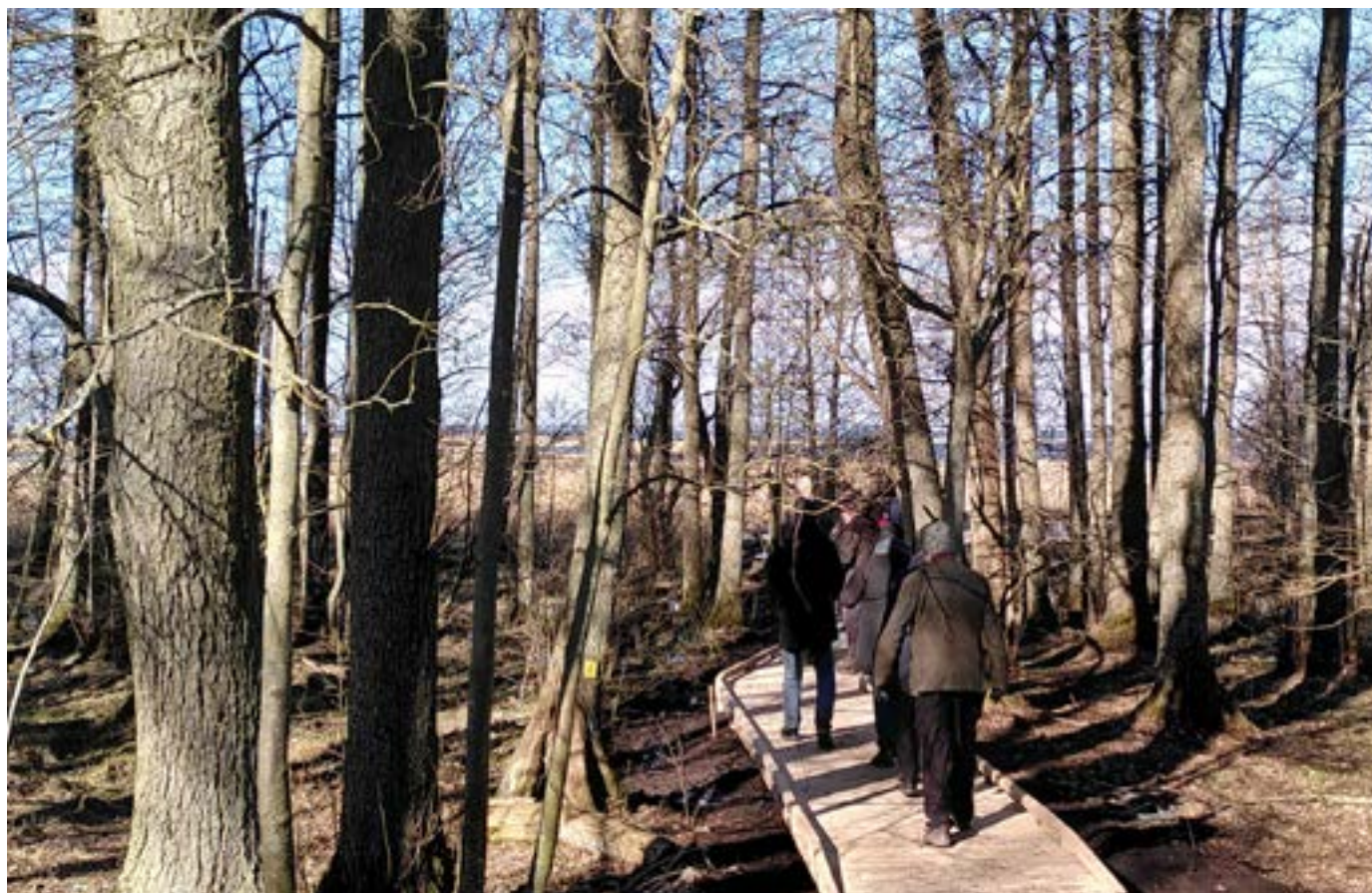
Bild: En spång med kanter är att föredra, som här på bilden.

Som seende är synen ofta det första sinnet för att få information och kunskap. Eftersom samhället är anpassat efter det riskerar personer med synnedsättning att missa viktig information. Du som är seende kan göra mycket för att underlätta för personer med synnedsättning.