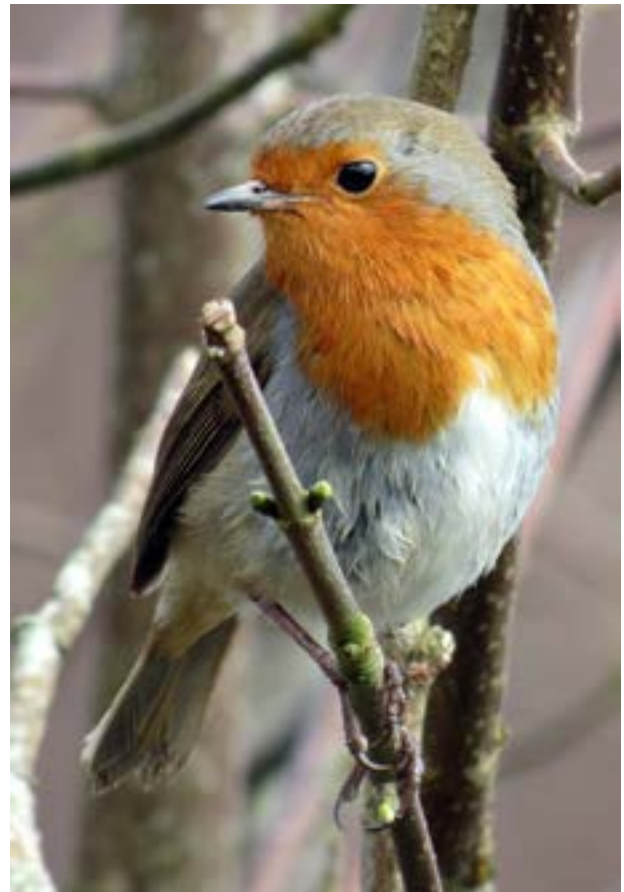
Bild: Rödhake på kvist.

Under denna första träff går ni igenom sången från ett tiotal allmänna arter från närområdet (eller arter som du räknar med att höra på era kommande besöksmål). Har gruppen stora förkunskaper kan ni givetvis öka på antalet arter, men det går alltid att lära mer om de arter ni redan kan till exempel genom att lyssna på olika inspelningar.