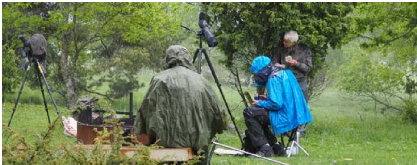
Bild: När det regnar är ofta fåglarna svåra att höra, men mellan skurarna kan det kvittra. Väljer ni att genomföra träffen trots regn är det viktigt med kläder efter väder, eller möjlighet till regnskydd.