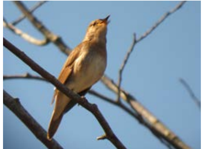
Bild: Näktergal som sitter på en gren och sjunger.

Är skarpa, korta och genomträngande läten/ljud som varslar om fara. En art som gräsparven har tagit detta ett steg längre och har till och med två olika varningsläten, beroende på om