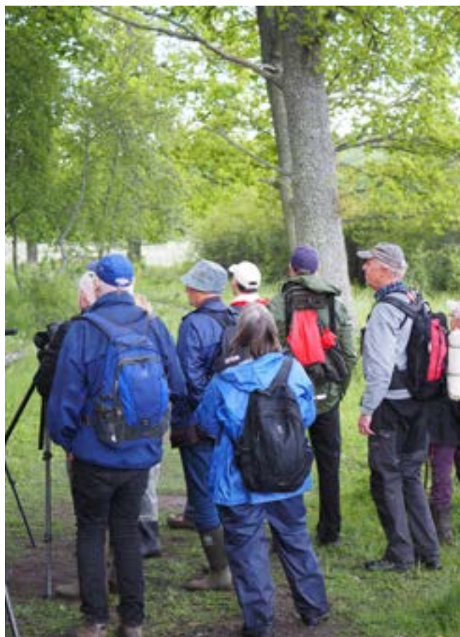
Bild: En grupp som just avnjutit en sommargyllings flöjtande toner.

TIPS: Studieförbunden har digitala utvärderingsverktyg som är ett bra komplement till era diskussioner och där deltagarna har möjlighet att anonymt lämna sina omdömen och förslag.