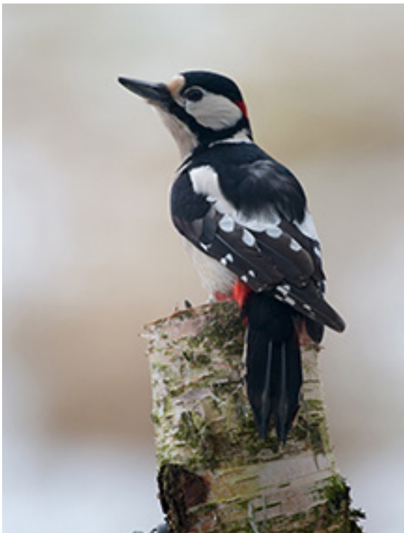
Större hackspett.

Den femte träffen handlar om vad de lokala/regionala fågelföreningarna kan erbjuda i form av exkursioner, föredrag och andra aktiviteter, men också om vilket fågelskyddsarbete som de bedriver. BirdLife Sveriges aktiviteter samt nationellt och internationellt fågelskyddsarbete uppmärksammas. Hur kan ni som deltagare bidra till att värna om fåglarna?