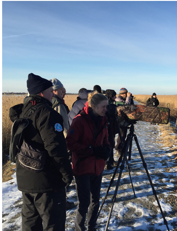
Tubkikare kan vara bra att ha när man skådar på långa avstånd.